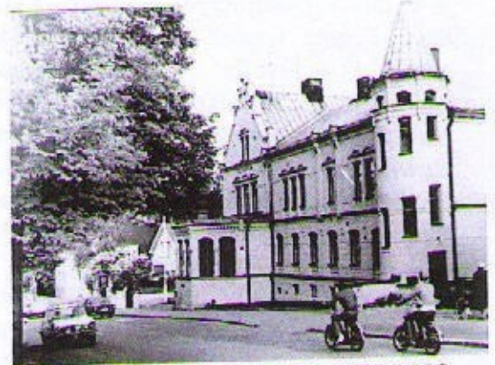
Toimitalo Kristinagatanilla 1975-1992

Suomen itsenäisyyspäivä vuonna -75 oli myöskin Katajaisille itsenäisyyspäivä. Kun Suomiseura Katajaiset pääsivät muuttamaan omiin toimitiloihin entiseen Käräjätaloon Kristinagatanille silloin saatiin kaikki toiminta saman katon alle.