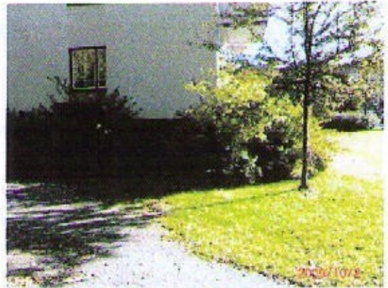
Tämän talon huoneisto oli Gideonsbergsgatanilla