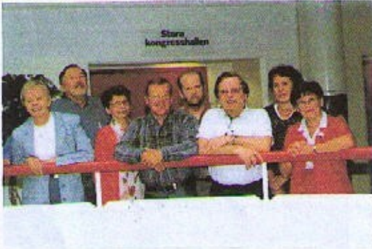
Kuvassa liittokokouksen vastaavat toimihenkilöt 1999.