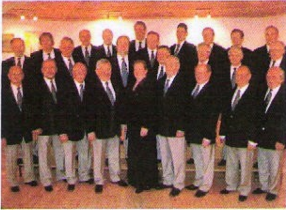
Mieskuoro AIKAPOJAT alkoivat laulamaan vuonna 1979.

Kun lähdettiin -80 luvulle oli seurassa jäseniä 1140. Seuran jaostot ja harrastusryhmät olivat lisääntyneet joita olikin nyt 25, jotka toimivat pääasiallisesti Kristiinagatanilla. Seuralla oli myöskin oma Baari joka vaikutti huomattavasti omalla tuotolla seuran toimintaan taloudellisesti. Yhteishenki oli käsin kosketeltavissa, kun oman saunan rakentamis haaveesta oli tullut totta edellisen vuoden puolella ja niinpä innokkaan talkootyön tuloksena saunapirtti rakennus valmistui ja voitiin pitää viralliset avajaiset marraskuussa -82 Lövuudenilla. Viimeiset Suomipäivät Vallbyssa pidettiin vuonna -82 jonka jälkeen Suomipäivät sekä perhepäivien vietto siirtyi Djäknebergille ja Lövuudenille. Jäsenmäärät pysyivät tuhannen jäsenen molemmiin puolin aina kahdeksänkymmentäluvun puoleenväliin saakka.