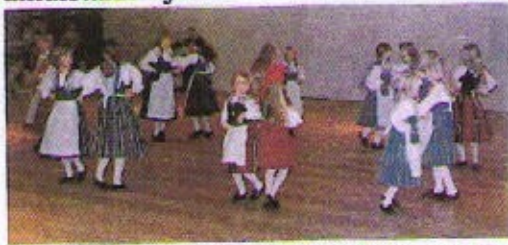
Katajaisten lapsitanhuajat 1970-luvulla

Seitsemänkymmentäluvun loppupuolella oli Katajaisten lapsitanhuajia toista sataa lasta ja nuorta. Ohjaajina toimivat aikuistanhuajat.