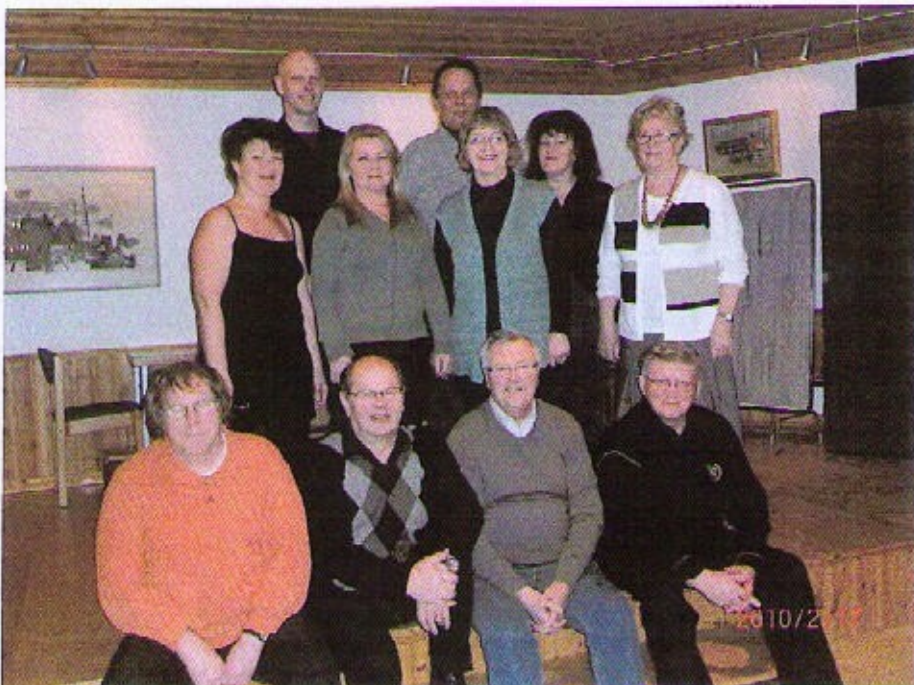
Kuvasta puuttuu Erkki Pörhö