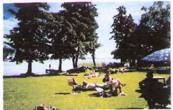
Suomiranta ”Mälارين keidas ”

Seuran nyt saavuttaessa kunnioitettavan 50 vuoden toiminnallisen iän voi vain toivottaa kaikkea hyvää ja toimintojen jatkuvuutta seuraaville toiminta vuosille.