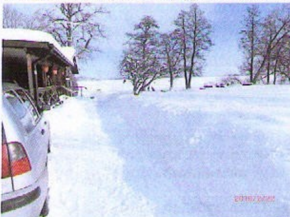
Talavinen kuva Suomirannasta 2010

Västerääsis keväällä 2010 Tervyyysin serkkus Paavo.