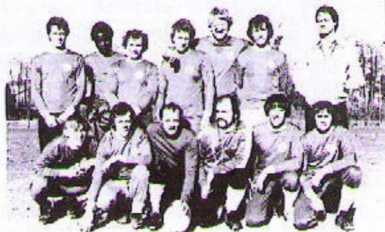
Miesten menestynyt jalkapallojoukkue

Katajaisten ensimmäinen oma lehti ilmestyi vuonna 1969 "Katajaiset kaiut". Suomalaisen kirjallisuuden hankkimiseksi Västeråsin kirjastoihin aloitteen tekijänä Suomiseura Katajaiset. Urheilutoiminta oli vilkasta heti seuran perustamisesta lähtien joukkueita ja harrastajia oli useissa lajeissa hyvällä menestyksellä myöskin kilpailuissa lajeja oli mm. yleisurheilu, jalkapallo, pesäpallo, lentopallo, pöytätennis, hockey-boockey, esimerkiksi lentopallo yleni -70 luvulla Ruotsin kakkos Div. ja Jalkapallo -80 luvun lopulla V Div.