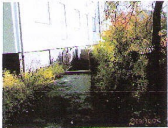
ja tämä Köpingsvägenillä.

Pian seuran perustamisen jälkeen toiminta lähti ripeästi käyntiin niinpä jo 25/5 järjestettiin ensimmäiset Naamiaiset Karnevaalit Västergårdenilla jossa soitti Sävel-Sepot.