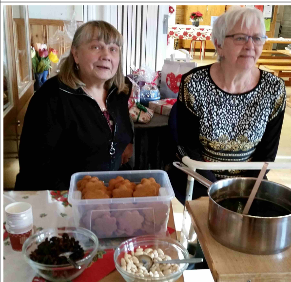
Näppärien puurojoulu Suomituvassa