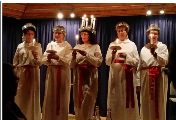
Vuoden 2015 Lucia