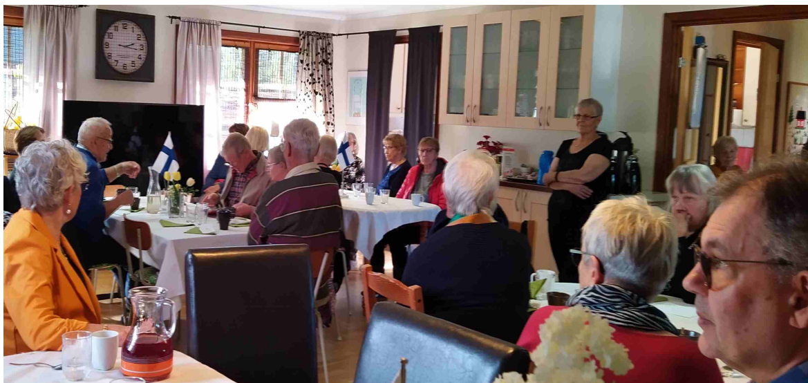
Gävlen suomalainen kerhon vieraana ruokailemassa