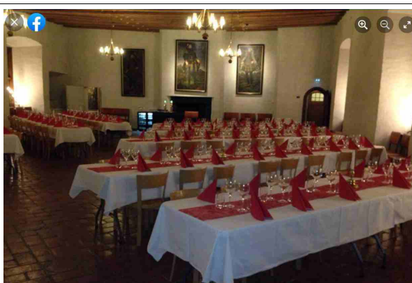
Pikkujoulu Västeråsin linnassa

Nämä joulunalusjuhlat ovat hyvää terapiaa ja rentoutusta sitä suurta juhlaa varten. Olemme jo monena vuonna valmistaneet laatikot, piiraat, tortut ym. Viimeisen kerran,... mutta..