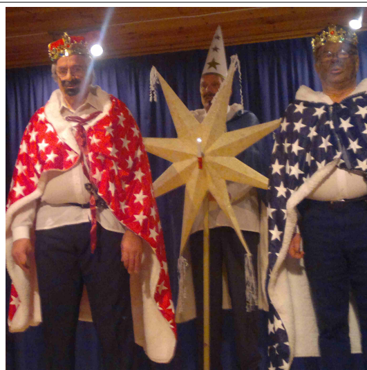
Vuoden 2014 Herodes