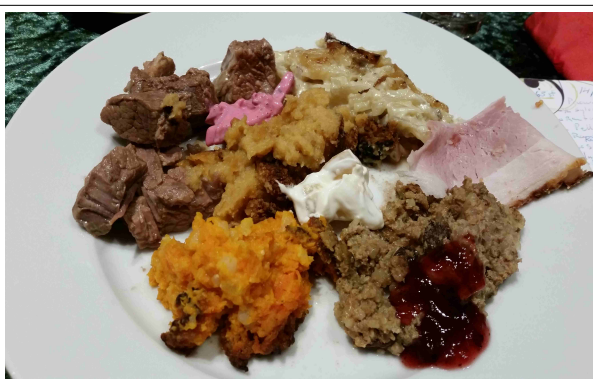
Jäsenten vanhanajan joulu

Joulun alla on ruokaa tarjolla jokaiselle oman mieltymyksensä mukaan. Lehden reportteri kierteli monet ruokapaikat tutkimassa mikä on millaistakin.