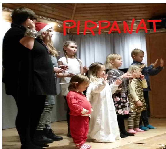
Vuoden 2017 Pirpanat