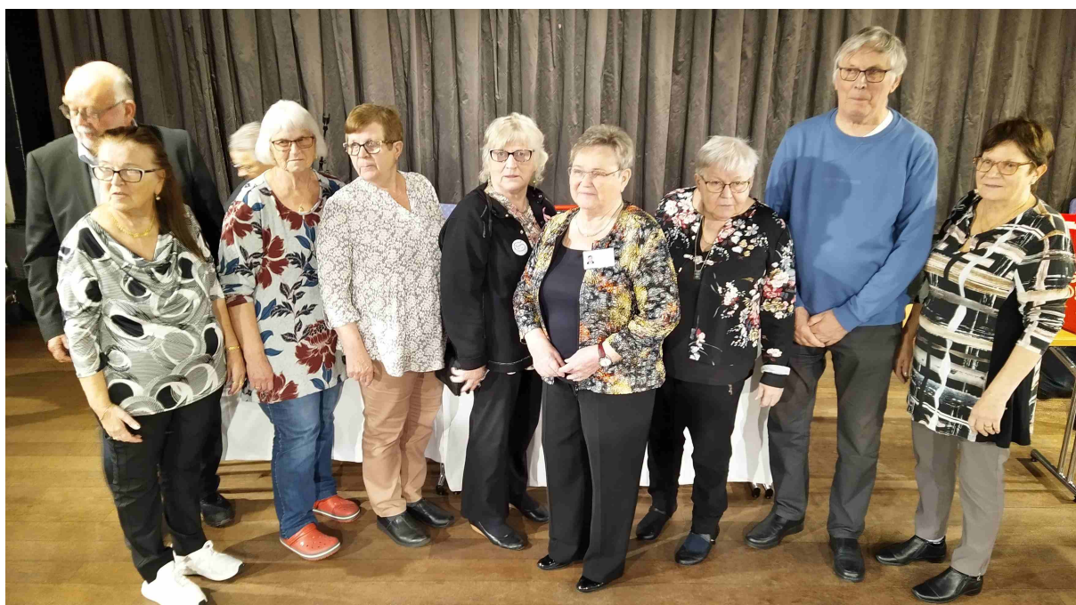
Uusi RSE johtokunta