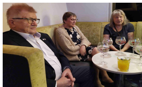
Katajaista kansaa jatkoilla

Tulomatkalla kuunneltiin esitystä miten ihmiset saadaan tyytyväisiksi seuratoiminnassa. Sitten jatkettiin kokousta pari tuntia ennen vapaata iltaa. Iltaruokailussa huomasi, että kokki on Suomen mestari ja tarjoilijallakin oli sama titteli. Asetelmat lautasilla olivat kauniit ja maku mitä mahtavin. Ilta kului rattoisasti seurustellen ja karaoketa laulaen. Bussissa istui samat henkilöt kuin mennessäkin, joten monia vanhoja ja uusia tuttavuuksia tapasimme.