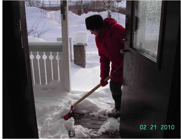
Lumisateisen yön jälkeen