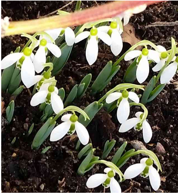
Lumipisararat kukkivat lumessakin