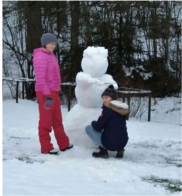
Lumiukko pystyy ennen vesisadetta