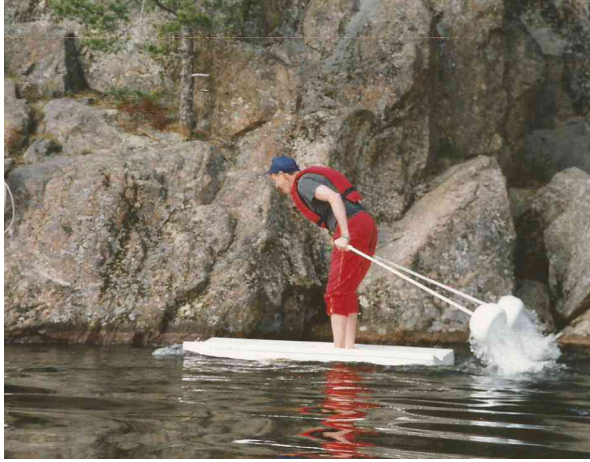
Vesihiihtoa ilman lunta ja jäätä

Odotatko aamuisia lumitöitä ja korkeita sähkölaskuja? Käveletkö mieluummin kuivalla polulla, kuin liukkaalla kadulla? Oli miten oli, mutta nyt on jo kevät ja aurinko meidän mieltämme valaisemassa.