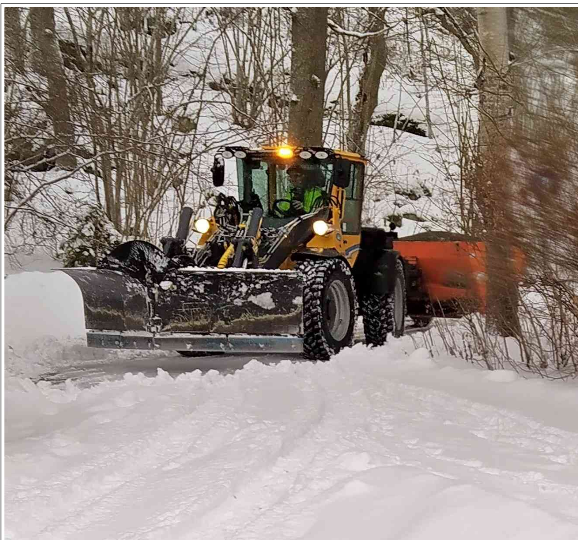
Meidän talvi tammikuulla