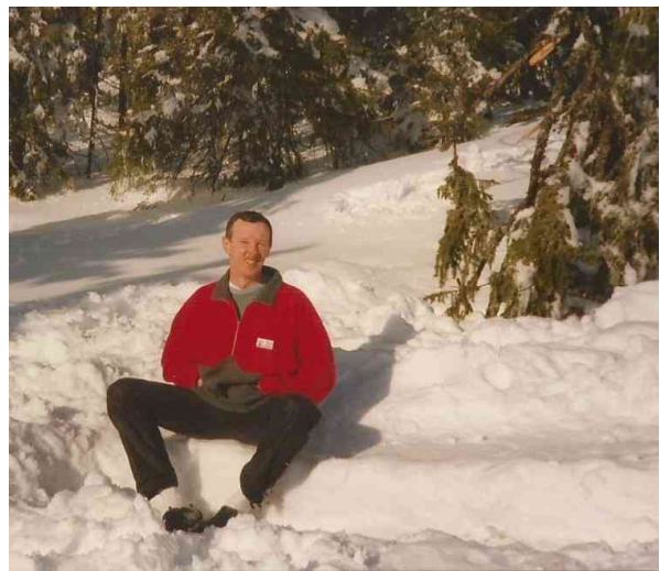
Aurinko antaa vitamiinejä